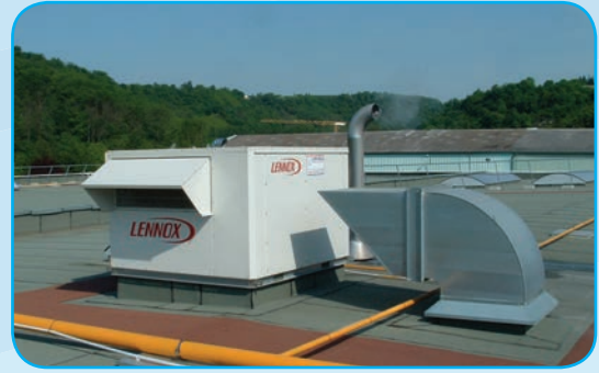
Rooftop bi-énergie (gaz + thermodynamique)