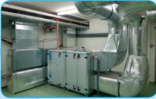
Centrale de traitement d'air : double flux