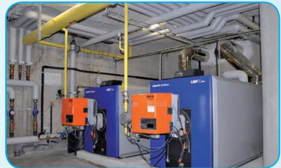
Chaufferie gaz - 1100 Kw