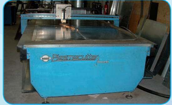
Table à découpe au plasma