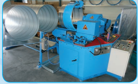
Fabrication de gaines circulaires