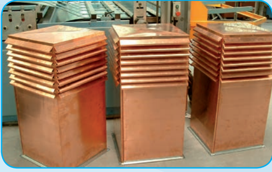
Sortie de toiture en cuivre