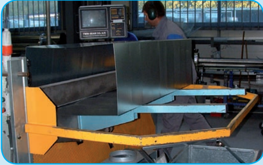
Fabrication de gaines rectangulaires