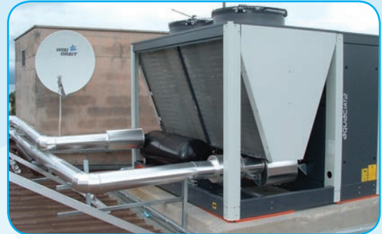
Groupe à eau glacée - Condensation à air