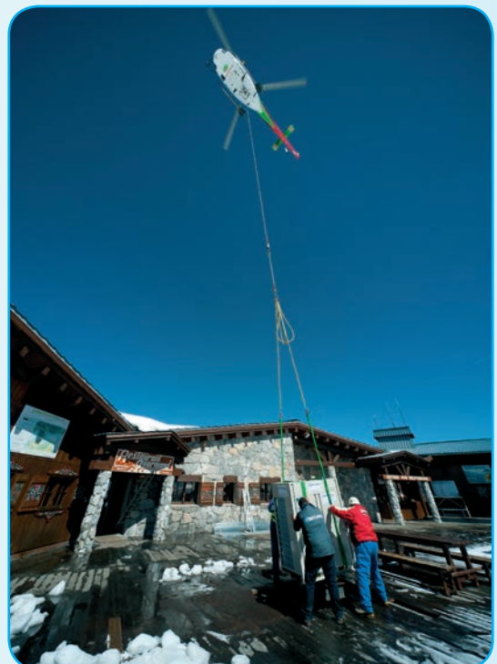
Héliportage Tignes 3032 m Le VRV le plus haut d'Europe