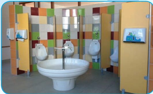
Sanitaire spécifique maternelle