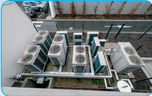
VRV 3 tubes et Eau Glacée pour chauffage et climatisation centre médical