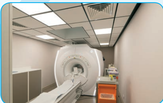
Process IRM centre médical